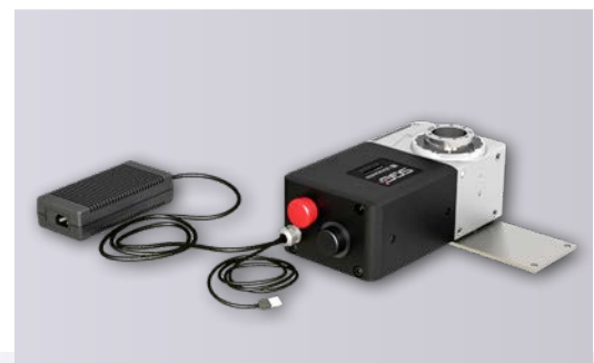
Neuer EA-508 light in Drehachslage vertikal, hier mit Fixplatte für den Einsatz auf Durchlicht-Glasplatte.

Die Dreh- und Schwenkachsen von pL LEHMANN aus Bärau in der Schweiz haben sich seit über 40 Jahren in der Fertigung bewährt. Sie ergänzen vielfach dreiachsige Bohr-/Fräsmaschinen und machen aus ihnen produktivere vier- oder fünfachsigte Bearbeitungszentren. Aufbauend auf dem über die Jahre ge-