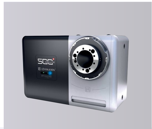
Поворотный стол pL LEHMANN, модель EA-510

Основу впечатляющего парка механической обработки MRT Castings составляют высокопроизводительные центры